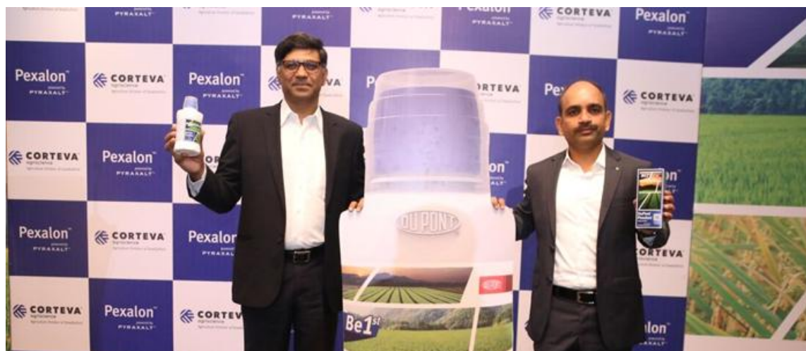
Corteva launches new pesticide for paddy

THE HANS INDIA | Jul 10,2018 , 02:52 AM IST